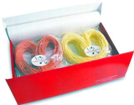
紅白ハート形 手延べ素麺 HAPPY HAPPY 1,080円/税込