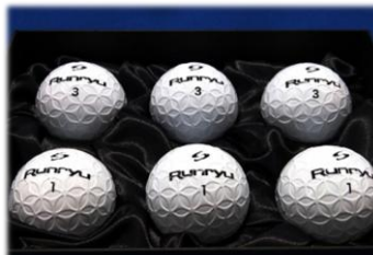
【記念日ギフト賞】 「SASO Runryu (ランリュウ) ギフトボックス」 (サソーグラインド スポーツ株式会社) 5,500円/税込