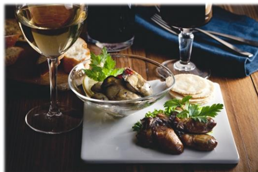
ワインに合う牡蠣・燻製牡蠣のオイル漬け ギフトセット梅 5,800円/税込