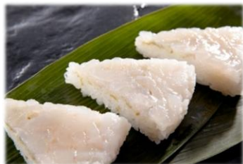
【ふるさとギフト最高賞】 「白えび寿し」 (有限会社寿々屋) 2,800円/税込